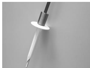
Der ZHSK plus im Einsatz mit dem Spezialwerkzeug

08.006.7 Produktdatenblatt 030-16:10.2018 © Design by Harald Zahn GmbH D.K